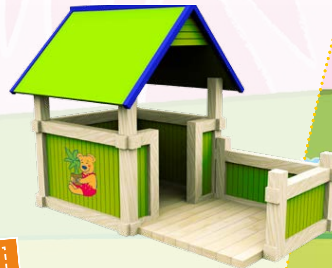
Immagine puramente indicativa